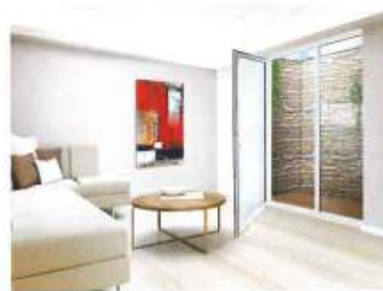
Komplettsystem „MEAVECTOR KOMFORT Lichthof“: Mit 2,05 Metern Breite und einer Tiefe von einem Meter bietet der Lichthof ausreichend Freiraum. Informationen unter: www.mea-bausysteme.com