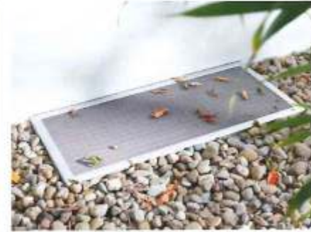
Lichtschatte „Lisa“ besitzt ein Edelstahlgewebe, das vor Laub und Ungeziefer schützt und äußerst stabil ist. Weitere Informationen: www.neher.de