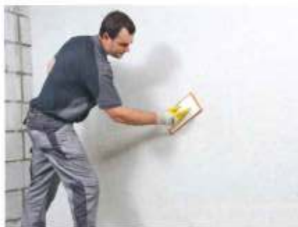
Mit Grundierung, Schnellmörtel und Klimaputz von hahne gelingt durch die schnelle Reaktionsfähigkeit der Inhaltsstoffe eine effektive Kellersanierung in nur vier Stunden.

Eine Möglichkeit, den Keller vor Feuchte und ihren Folgen zu schützen, bietet das INTRASIT-RZ-System ( www.hahne-bautenschutz.de , Bild unten) an. Nach einer gründlichen Untergrundvorbereitung wird zunächst die Gründung aufgetragen. Nach dem matfeuchten Ausrocknen kann diese dann mit dem Dichtmörtel bedeckt werden, der wiederum bereits nach einer Stunde überarbeitbar ist. Final nun nur noch den Klimaputz auftragen und nach drei Stunden abreiben – und schon ist die Sanierung durchgeführt und die kalte und feuchte Jahreszeit kann kommen.