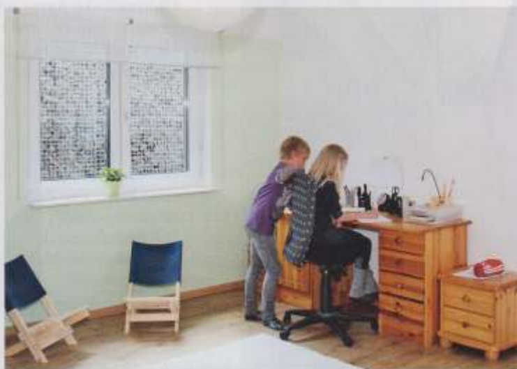
Kostengünstiger, freundlicher Lebensraum: Dank des Kellers muss kein Kind auf ein eigenes Reich verzichten.

Die Patchworkfamilie ist mit dem Resultat sehr zufrieden: „Die Integration des Kellers in den Wohnbereich ist gelungen und kein Kind muss auf ein eigenes Zimmer verzichten. Jetzt gibt es viel Raum zum Spielen, aber auch zum Zurückziehen.“